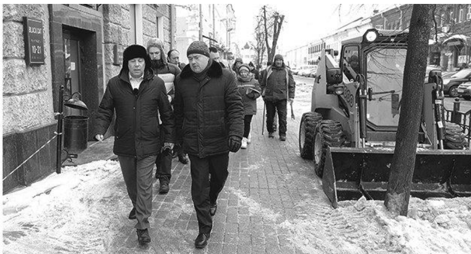
► Глава региона лично проверил состояние улиц Ярославля

«Начинаем большую работу по благоустройству области.