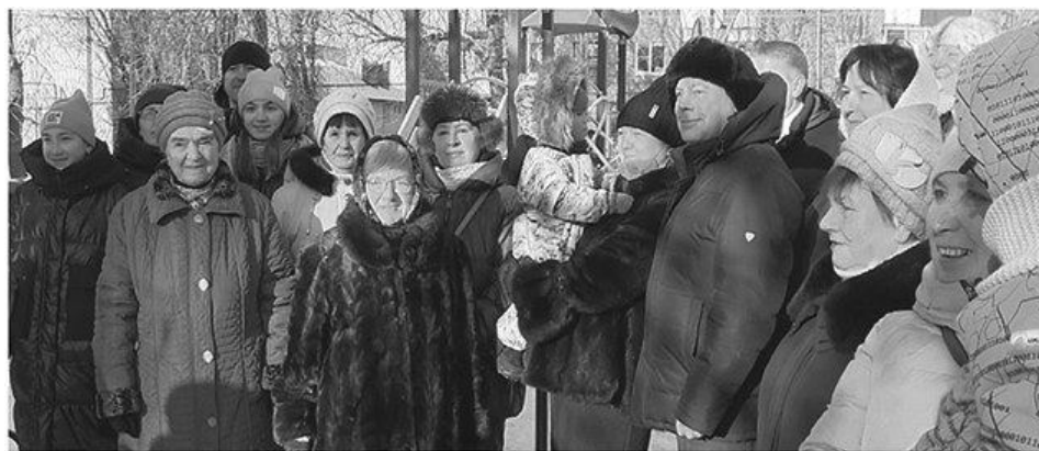
► Жители показали губернатору новую детскую площадку в своем дворе

Михаил Евраев: Минсельхоз России поддерживает проекты развития только тех населенных пунктов, где проживают больше тысячи человек. Поэтому сельские территории с меньшим числом жителей оказываются «за бортом». У нас в Ярославской области таких населенных пунктов 166. Это более 70 тысяч жителей. Нельзя оставлять их без помощи. Поэтому принято решение о поддержке со стороны региона. Деньги на это есть. Все необходимые документы будут подготовлены в ближайшие месяцы, финансирование начнем со следующего года.